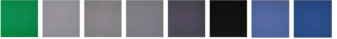
Açık Yeşil 210